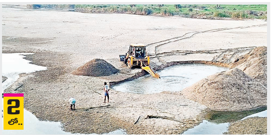
డాక్టర్ రామచంద్రనాయక్ ఇసుకను అరికట్టాలని నిండు సభలలో అధికారులకు ఎమ్మెల్యే ఆదేశించినప్పటికీ మండలంలో మాత్రం ఇసుక అక్రమ రవాణా ఆగడం లేదు ఆకేరు వాగు ప్రాంతం నుండి

నర్సింహులపేట, ప్రభాతవార్త మహబూబాబాద్ జిల్లా నర్సింహులపేట మండలంలో ఆకేరు వాగు ప్రాంతం నుండి ప్రతిరోజు ఎలాంటి అనుమతి పత్రాలు లేకుండా రాత్రి పగలు అనేది తేడా లేకుండా ఆకేరు వాగు ప్రాంతంలోని ఇసుకను తోడేస్తున్నారని ప్రభుత్వ సిబ్బందనల మేరకు ప్రభుత్వ అనుమతులు ఉంటే తప్ప ఇసుకను తోలుద్దని ప్రభుత్వం ఆదేశించి ఇసుకను అరికట్టి ఇసుక పాలసీ అమలు చేసినప్పటికీ పదేపదే వివిధ సభలు సమావేశాల్లో డోర్నకల్ ఎమ్మెల్యే ప్రభుత్వ విప్